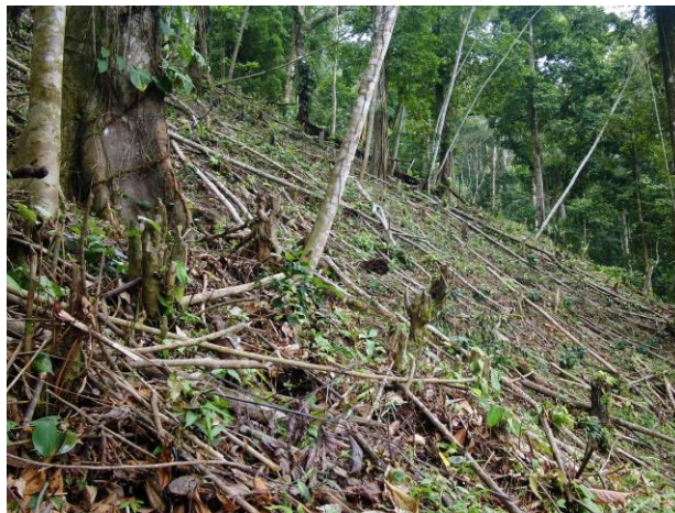
Figura 4. Riesgo a deslizamientos y áreas deforestadas, La Unión

El constante deterioro de los recursos naturales como la deforestación y la falta de protección en las zonas de recarga hídrica; evidencia ausencia de acciones orientadas al manejo integral de las micro cuencas, entre otros, lo cual incide en la vulnerabilidad del municipio ante las amenazas de deslizamientos, hundimientos y derrumbes principalmente, ante un fenómeno de lluvias torrenciales; como los ocurridos en julio del 2008.