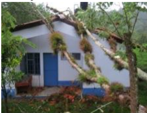
Figura 1. Puesto de salud, La Unión

Debido al surgimiento de casos de desnutrición aguda detectados en el año 2007 el municipio de La Unión se declaró en hambruna; aunque año con año se ha realizado esfuerzos en la actualidad es el municipio con mayor índice de desnutrición crónica del departamento, entre cuyas causas figura la cobertura insuficiente en los servicios de agua y saneamiento básico, que son competencias propias de la municipalidad; así como las deficientes condiciones habitacionales de las familias en pobreza extrema y la falta de cobertura del servicio de salud.