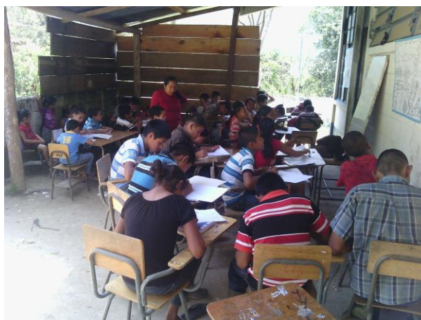
Figura 2. Escuela de nivel primario, La Unión

La situación de la educación del municipio se centra especialmente en la alta deserción escolar y a pesar de ser una competencia delegada la municipalidad tendrá a bien intervenir para contrarrestar esta problemática, todo ello a través de incentivar a la población con la dotación de becas escolares a familias de escasos recursos y de la misma manera atender el déficit en la infraestructura educativa según su disponibilidad financiera.