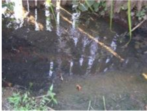
Figura 3. Contaminación por aguas residuales, La Unión

El municipio es productor cafetalero, tienen más de 90 beneficios de café, de los cuales la gran mayoría no cuenta con sistema de tratamiento, cuyas aguas mieles contaminan ríos y quebradas; así mismo, se tiene sistemas de alcantarillado sanitario en la cabecera municipal y 4 comunidades rurales, los cuales vierten directamente contaminando los afluentes hídricos. Otra fuente de contaminación lo constituyen los desechos sólidos, empezando con que no se cuenta con vertedero municipal propio, por lo que la basura se deposita en lugares no autorizados.