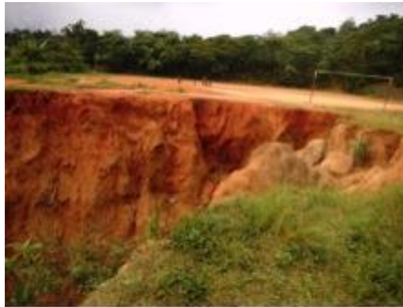
Figura 5. Instalaciones deportivas, La Unión

Otro de los aspectos a mejorar en el municipio de La Unión es la cobertura de energía eléctrica la cual ha sido la más baja del departamento de Zacapa, a pesar que es uno de los servicios básicos importantes para el desarrollo del municipio y sus comunidades.