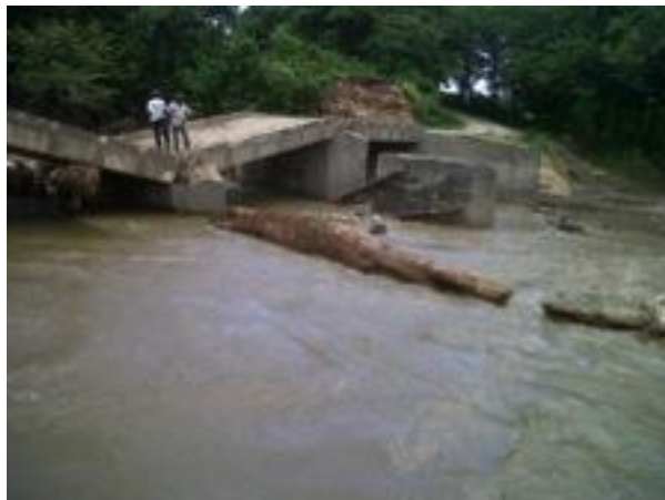
Figura 6. Deterioro infraestructura vial, La Unión

La Unión se caracteriza por su topografía accidentada y posee la mayor precipitación pluvial del departamento de Zacapa, factores que determinan el constante deterioro de las carreteras del área rural, lo cual limita el tránsito vehicular; asimismo, a raíz de la reconstrucción del sistema de alcantarillado sanitario, varias calles de la cabecera municipal se encuentran deterioradas.